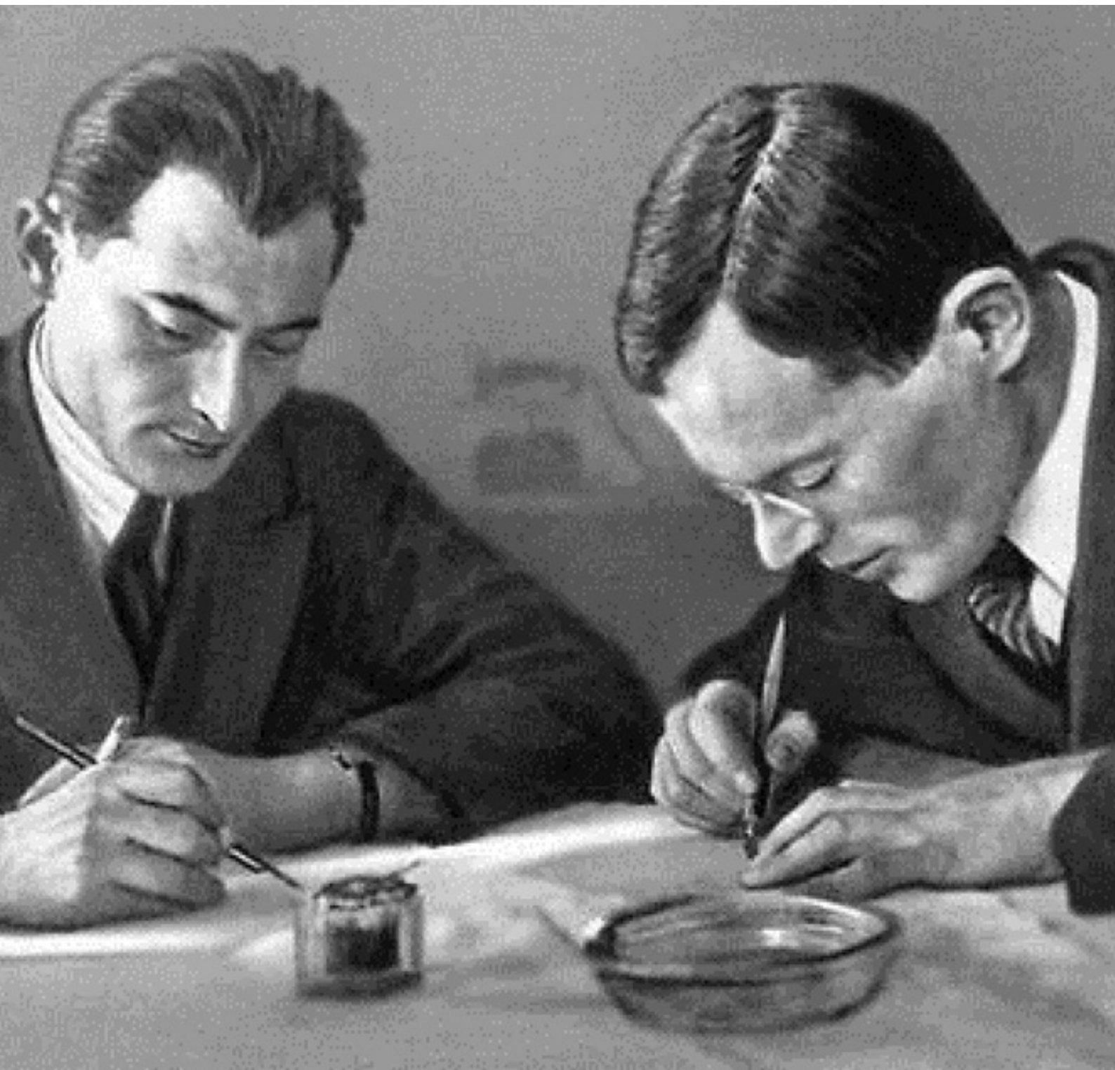
Evgenij Petrovič Petrov (1903-1942) e Il'ja Arnol'dovič Il'f (1897-1937).