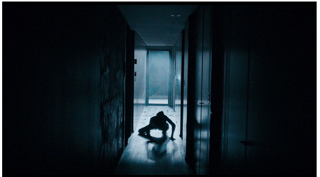
MadS di David Moreau.

Creature mostruose sono anche quelle raffigurate in The Complex Forms di Fabio D'Orta, storia ambientata in una villa dove le persone hanno l'occasione di cambiare il proprio destino vendendo il corpo a misteriose entità in cambio di denaro. Per alzare il tiro e tuffarsi nello splatter c'è Destroy All Neighbors di Josh Forbes che mette in scena uno scontro senza esclusione di colpi, davvero infernale tra due vicini di casa.