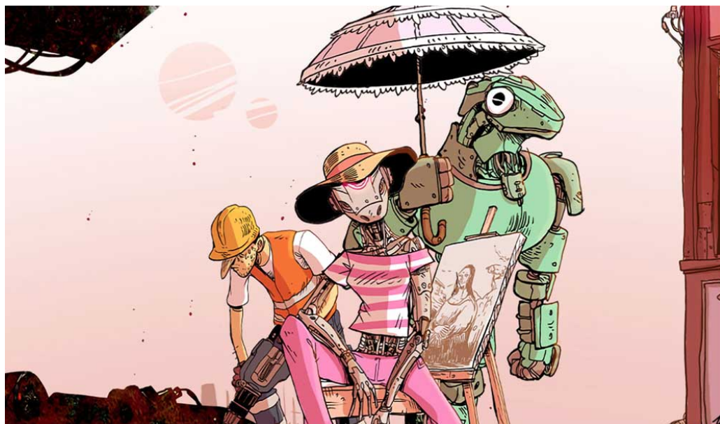
Illustrazione di Zerocalcare per TS+FF 2024.

Sarà perché è il tema per eccellenza, fonte e spunto di dibattito talvolta anche superficiale per non dire pretestuoso, sarà perché quest'anno a rinforzare le schiere c'è Italcon (Convegno Italiano del Fantastico e della Fantascienza), oppure semplicemente perché la fantascienza non può esimersi dal congetturare scenari futuri a partire dai semi del presente, fatto sta che l'edizione 2024 del Trieste Science+Fiction Festival è ufficialmente all'insegna dell'intelligenza artificiale. Basti dare uno sguardo all'illustrazione disegnata quest'anno da Zerocalcare, suggestiva e inquietante al tempo stesso nel prospettare un futuro poco entusiasmante per l'essere umano declassato al rango di classe lavoratrice umilissima al servizio dei figli dell'IA generativa. La presenza di Zerocalcare al TS+FF non si limita a questa immagine, perché alle sue opere sarà dedicata una mostra negli spazi del Teatro Miela, visitabile gratuitamente durante tutti i giorni del festival. Il focus sull'intelligenza artificiale non sarà relegato al cinema ma si proverà a raccontarne le sfide e i timori evocati con eventi collaterali, performance e dimostrazioni live.