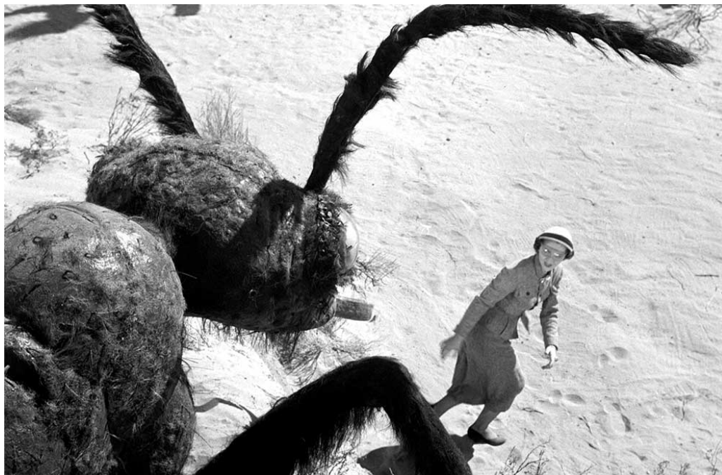
Assalto alla Terra (1954), Gordon Douglas.

Ultimo dei lungometraggi in calendario è Assalto alla Terra ( Them! ) di Gordon Douglas, che con un taglio documentaristico raccontava nel 1954 di uno scomodo effetto collaterale provocato dalle radiazioni atomiche: per raccontare l'invasione da parte di formiche mutate in mostri giganteschi. Documentario a tutti gli effetti è invece l'ultimo dei titoli inseriti nella sezione Sci-Fi Classix, ovvero The Life and Deaths of Christopher Lee (2024) di Jon Spira, documentario dedicato all'icona del cinema di genere e premio alla carriera del TS+FF nel 2009.