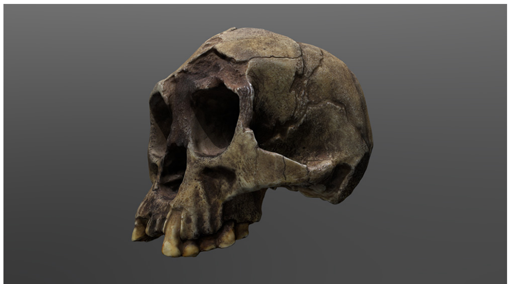
Il cranio dell' Homo floresiensis in 3D.

Il testo di Westerman è quindi un oggetto molto variegato, in cui i collegamenti sono spesso intrecciati tra loro, e il dubbio, o per lo meno un'epochè husserliano, diventa l'unico filo conduttore che l'autore permette. Sotto una formale imparzialità e una effettiva onestà intellettuale si nasconde però una emotiva partecipazione a un mondo di valori forti, dove l'umanità si erge nella grandezza delle sue opere, dalle piramidi alla scienza moderna, e i valori dell'occidente restano quelli che meglio di tutti permettono anche a chi non vi appartiene di usufruire dei suoi benefici. Solo qui, nella vecchia Europa siamo stati in grado di mettere in discussione i nostri stessi fondamenti, permettendo quindi al resto del mondo quella emancipazione che forse altrimenti non sarebbe mai giunta.