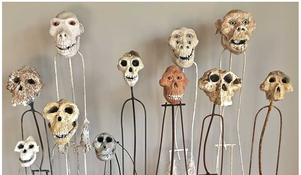
Hominids di Breval.

contesto e che chiarisce così cosa dobbiamo aspettarci dal proseguo della lettura: Noi, umani , con quella virgola che delinea le implicazioni così come le responsabilità. Siamo noi, autore e lettori, insieme, l'oggetto di questo testo. È di noi che si parla, e siamo noi stessi a parlarne. Ci guardiamo allo specchio, riflettiamo su ciò che siamo. Non tanto su ciò che facciamo, se non nella misura in cui ci interessa il modo in cui agiamo, il nostro essere agenti, quanto piuttosto espressamente sul nostro statuto ontologico. Noi , e si definisce il contorno, l'orizzonte, il limite. Umani , ovvero un aggettivo, una modalità dell'essere. Si noti inoltre che non vi è alcun verbo, non vi è una frase completa, uno spazio linguistico dove il soggetto possa agire (o subire) una azione caratterizzata da un complemento. Vi è solo un evento, un accadere, un dato, una posizione, un fatto, direbbe Westerman. Noi, umani . Quasi fossimo contrapposti a ogni altro ente o categoria, un titolo figlio della drammatica necessità di identificarsi e differenziarsi. L'assenza del verbo fa emergere una ulteriore particolarità, che merita di essere specificata.