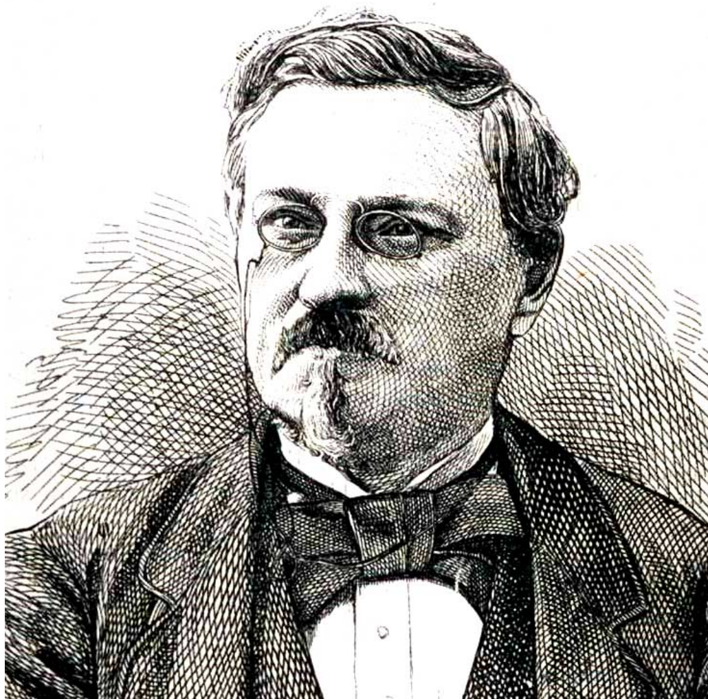
L'economista liberale Gustave de Molinari "padre fondatore" della panarchia insieme a Paul-Émile de Puydt.

In seguito alla sua prima teorizzazione nella metà del diciannovesimo secolo nei testi dell'economista belga Gustave de Molinari e in quelli del connazionale Paul-Émile de Puydt (un botanico che primo utilizzò il termine in un articolo pubblicato nel 1860 sulla Revue Trimestrielle di Bruxelles) la panarchia è stata bollata come utopia e accantonata persino da intellettuali di tradizione più liberale, lasciando maturare il sogno panarchico solo nelle menti di alcuni. L'idea sarà poi ripescata nella seconda metà del ventesimo secolo da due anarchici tedeschi, Kurt e John Zube, che la svilupperanno ulteriormente.