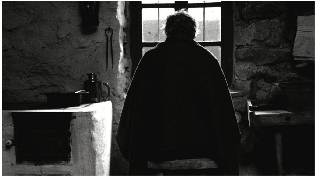
L'ultimo film di Béla Tarr girato assieme ad Agnes Hranitzky: Il cavallo di Torino (2011).

Il gesto allo stesso tempo formale, politico ed etico che guida le modalità e gli esiti dell'impresa filmica di Béla Tarr, pare a tutti gli effetti trovare la propria origine in quello che potremmo chiamare infatti un desiderio di penetrazione nell'intimo agglutinarsi delle cose. La decisione fondamentale di articolare la pratica registica secondo la tecnica del piano sequenza, risponde del resto a un preciso indirizzo conoscitivo che, guardando all'uomo come a un essere radicato in un mondo che gli si presenta come un prisma di enti gravidi di rimandi, affida al succedersi delle immagini il compito di schiudere attraverso l'arte, l'invalidabile situatività ontologica che ancora l'essere umano – come personalità aperta e irrisolta – agli altri individui e all'ambiente che abita: quel mondo attanagliato dai suoi stessi agenti atmosferici, quella natura estenuata dal vento, alienata dal fango e dalle mille piogge micronizzate che non cessano nemmeno un attimo di martoriare la fragile terra, la zona degli umani.