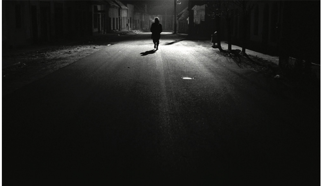
Le armonie di Werckmeister (2000) tratto dal romanzo Melancolia della resistenza di László Krasznahorkai.