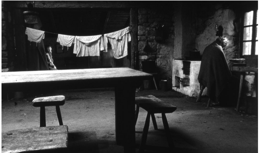
Un'altra inquadratura da Il cavallo di Torino .