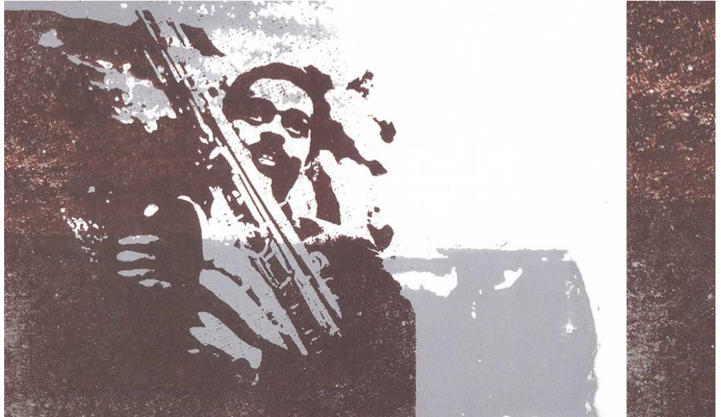
Albert Ayler in una foto di Val Wilmer rielaborata graficamente e inserito nel box Holy Ghost (Revenant, 2004).

americano. Difficile trovare qualcosa di così accurato e allo stesso tempo ispirato e artistico come il libro della Wilmer, in particolare i capitoli "musicali", tanto da dover raccomandare questo testo a chiunque abbia intenzione di suonare o solo ascoltare jazz, o qualsiasi altro genere musicale.