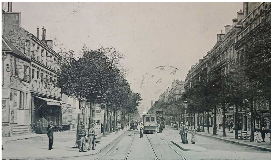
La Parigi dell’infanzia di Julien Green: il XVI arrondissement Paris-Passy, Avenue Kleber, Prise De La Place Du Trocadero.

È difficile per il lettore rimanere indifferente di fronte a questo invito a girovagare ora nel Marais, ora per Passy, o nel quartiere della Bourse, oppure per Saint-Julien-le-Pauvre, sempre tenendosi a debita distanza dalle mete privilegiate dal turismo, prede predilette del consumo di massa a iniziare dalla Tour Eiffel, aborrita da Green “fin dall’infanzia”, come tiene a precisare in Passeggiata d’estate , uno dei testi raccolti in Parigi . In realtà, è un invito a gironzolare nella memoria di Green, una memoria lunga un secolo, quasi per intero trascorso nella “città della luce” come recita un passo di Paesaggio parigino .