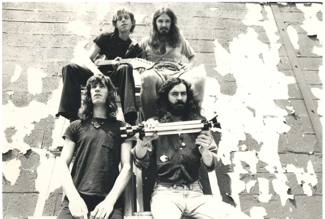
I Muffins ai tempi dell'album Manna/Mirage .

gruppo: il lavoro è una mirabile sintesi di tutta l'attività svolta in questi anni, con un alternarsi di atmosfere canterburiane, sprazzi zappiani, porzioni improvvisative e slanci melodici. Sicuramente un ottimo album, probabilmente il migliore della formazione. Tuttavia, l'affermarsi del punk e della new wave getta un ulteriore ostacolo sulle possibilità di suonare per i Muffins, già non così numerose, e nonostante i contatti e le buone recensioni del primo lp le difficoltà crescono sempre più. A metà del 1979 registrano, in una edizione limitata di mille copie, il loro secondo vinile, Air Fiction , autoprodotta e composta interamente da improvvisazioni, una facciata in studio e un'altra dal vivo. Pubblicato senza nessuna etichetta, soprattutto per permettere al gruppo di organizzare un tour nell'East Cost, l'album non avrà il successo e la funzione auspicati dalla band. Il rapporto di fiducia costruito con Fred Frith porta i Muffins alla pubblicazione del loro, a tutti gli effetti, secondo album ufficiale, 185 , sempre per la Random Radar Records, prodotto proprio dall'ex chitarrista degli Henry Cow, e registrato dal 24 al 28 settembre del 1980.