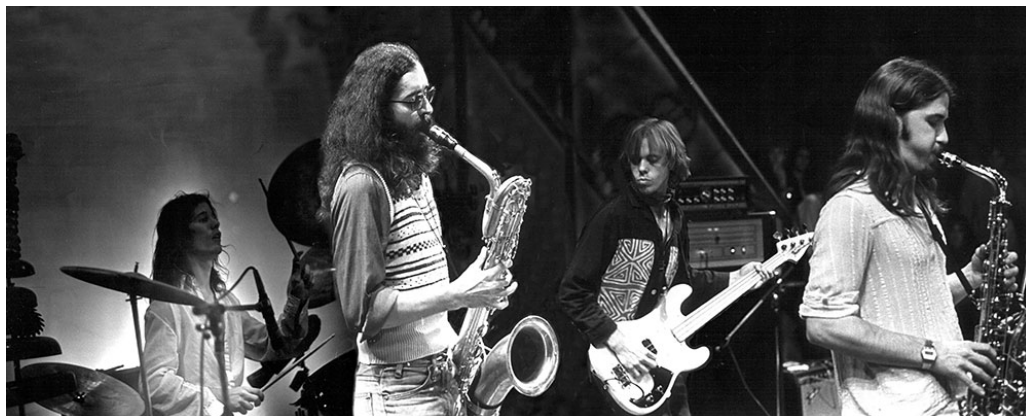
The Muffins in azione nel 1978.

Il passaggio dalla loro vecchia abitazione, Buba Flirf, alla nuova Portree House sempre nel Maryland, avviene più o meno in contemporanea con la fondazione della loro etichetta, la Random Radar Records (insieme, tra gli altri, a Steve Feigenbaum, futuro fondatore della Cuneiform e amico e collaboratore del gruppo), a testimonianza di un'attività veramente autogestita, sulle orme delle esperienze europee del Rock In Opposition. È un periodo questo caratterizzato anche da numerose registrazioni (nel 1975 registreranno ai Paragon Studios, insieme a Stuart Abramovitz, materiale che poi verrà pubblicato successivamente su Chronometers nel 1993 dalla Cuneiform Records), dai rapporti assidui con John Paige, dj della WGTB radio, emittente della Georgetown University, che avrà un ruolo di supporto e favorirà un minimo la conoscenza della musica del gruppo, dai free festival autorganizzati dove saranno presenti anche altre formazioni minori ma attigue all'estetica Muffins, fino al primo disco pubblicato dalla Random Radar Records, A Random Sampler , con all'interno brani del gruppo stesso, di Fred Frith (vero e proprio nume tutelare), Lol Coxhill, Logproof, Mars Everywhere, Steve Feigenbaum, Illegal Aliens. Insomma, il tentativo di costruire, così come era accaduto in Europa, una vera e propria area alternativa, seppur meno politicizzata, ma caratterizzata da una musica complessa, di matrice rock ma fortemente segnata da una pratica costante di improvvisazione libera e sperimentazione.