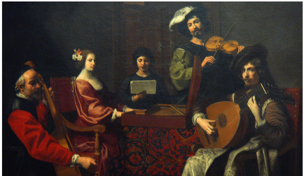
Nicolas Tournier, Le concert (1630 – 1635).

Queste parole sono l'incipit de L'eloquenza delle lacrime , il saggio incompiuto a cui Charvet ha dedicato la vita. Dopo questa dichiarazione di intenti mirabilmente riunita in tre frasi il testo procede cercando legami, sciogliendo nodi e aprendo percorsi di rara raffinatezza. Oggi l'editore Medusa ha ripubblicato il corpus delle poche e brevi opere dell'artista francese. Nel volume appena citato, rispetto alla precedente edizione, pubblicata una prima volta nel 2001, a ridosso della precoce scomparsa, è stato aggiunto un importante saggio: Le Lacrime nell'epoca barocca, un paradosso eloquente . Inoltre, nella ristampa di un secondo volumetto intitolato Il canto degli angeli e la voce delle passioni , sono stati riuniti i testi e gli articoli scritti nei pochi anni che ha vissuto, e apparsi principalmente in riviste di settore, o in luoghi in un certo qual modo predestinati ad accogliere certi pensieri, come per esempio tra gli allegati ai programmi dei concerti. Di fatto probabilmente si tratta dell'opera omnia di questo geniale studioso. È un corpus di dimensioni modeste, ma dotato di grande profondità e spessore, di un'acutissima capacità di creare ponti tra elementi apparentemente diversi tra loro.